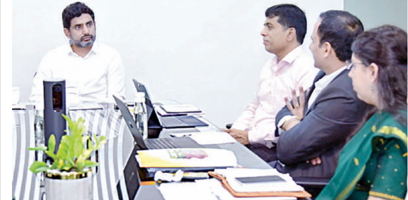
మంగళవారం ఇంటర్ విద్యపై అధికారులతో మంత్రి సమీక్ష నిర్వహిస్తున్న మంత్రి నారా లోకేశ్

ఆంధ్రప్రదేశ్ మంత్రిమండలి సమావేశం ఈ నెల 6వ తేదీ బుధవారం జరుగుతుంది. ఉదయం 11 గంటలకు ఈ సమావేశం ముఖ్యమంత్రి చంద్రబాబు అధ్యక్షతన జరుగుతుంది. ల్యాండ్ గ్రాబింగ్ యాక్ట్ 1982 బిల్లు ప్రతిపాదనపై కేబినెట్ కీలకంగా చర్చిస్తుంది. భూసేకరణ పట్టంలోని కొన్ని నిబంధనల కారణంగా భూ అక్రమణల్లో కేసుల నమోదుకు ఇబ్బందులు వస్తున్నట్లు రాష్ట్ర ప్రభుత్వం గుర్తించింది. గత ప్రభుత్వ హయాంలో లక్షల ఎకరాల అన్యాయాన్ని ముగింపుగా ప్రభుత్వం అభిప్రాయపడుతుంది. ఇందుకు సంబంధించి వలు ఫిర్యాదులను తాజా ప్రభుత్వానికి వచ్చాయి. ప్రభుత్వానికి అందుతున్న ఫిర్యాదుల్లో 80 శాతం భూ అక్రమణలపైనే ఉన్నట్లు ప్రభుత్వం స్పష్టం చేసింది. ప్రస్తుత చట్టంలో భూ అక్రమణలపై చర్యలు తీసుకునేందుకు ఇబ్బందులున్నాయని ప్రభుత్వం భావిస్తోంది. దీని స్థానంలో కొత్త చట్టం తేవాలని ప్రభుత్వం నిర్ణయించింది. ఇందులో భాగంగానే భూసేకరణ చట్టం 1982ను రద్దు చేయాలని ప్రభుత్వం నిర్ణయించింది. కొత్తగా ల్యాండ్ గ్రాబింగ్ ప్రొజెక్షన్ బిల్లు-2024 తీసుకుని వచ్చే దిశలో ప్రభుత్వం నిర్ణయిస్తుంది. మంత్రివర్గ సమావేశంలో ఈ అంశంపై చర్చించి ఆమోదించే అవకాశం ఉంది. నావికాదళ పోస్టులో టీటీఎల్ 34 శాతం రిజర్వేషన్ కల్పించడం తదింకాలపై మంత్రి వర్గం చర్చించి నిర్ణయం తీసుకునే అవకాశం ఉంది.