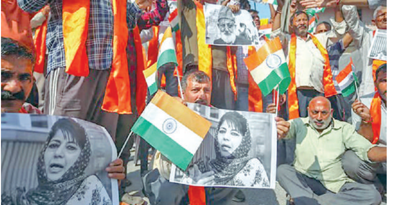
జమ్మూలో ఆర్థిక 370 రద్దుకు మద్దతుగా శివసేన కార్యకర్తలు మంగళవారం భారీ ప్రదర్శన ధ్వజం