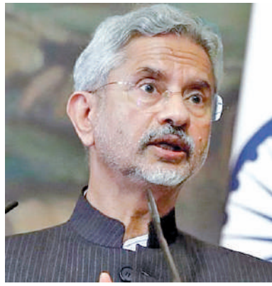
కాన్ బెల్లా, నవంబరు 5: అతివాద శక్తులకు కెనడా రాజకీయాల్లో చోటు కల్పిస్తున్నారని భారత విదేశాంగ మంత్రి ఎన్.జైశంకర్ మండిపడ్డారు. ఇటీవల అక్కడి హిందూ ఆలయంపై జరిగిన